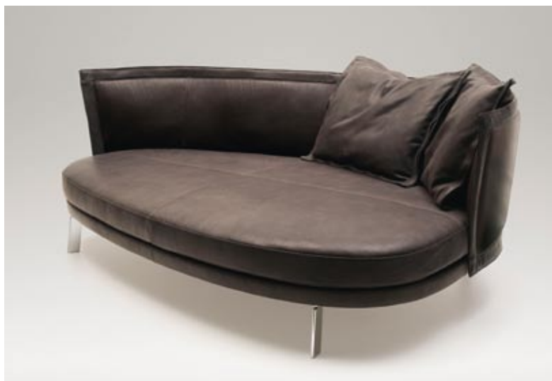
DS-196 AN ISLAND FOR SEATING AND MEETING PEOPLE DS-480 RADICAL COCOONING DS-9046 WOVEN ELEGANCE

SUPPLÉMENT SALONE INTERNAZIONALE DEL MOBILE 2011